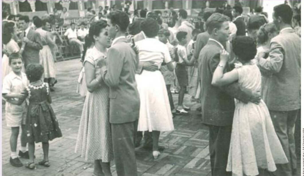
ARXIU MUNICIPAL DE GRANOLLERS

Granollers En aquesta fotografia d'autor desconegut es poden veure unes parelles de joves i uns nens durant un ball d'envelat, tradicional de les festes majors, però no es coneix el poble ni l'any en què es va fer. És una de les imatges que es conserven a l'Arxiu Municipal de Granollers i de les quals no hi ha prou informació per saber-ne el moment ni les persones que hi apareixen. Si tenen dades d'aquesta instantània, poden posar-se en contacte amb l'Arxiu Municipal de Granollers per correu electrònic a arxiufotografic@granollers.cat o als telèfons 93 861 19 08 i 93 842 67 37.