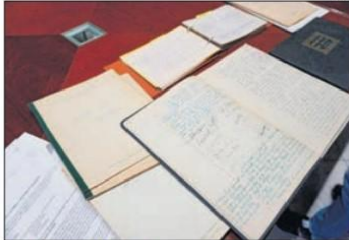
DONACIÓ Alguns dels documents que conservarà l'Arxiu Municipal