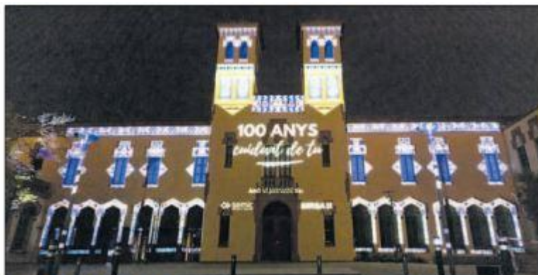
PROJECCIÓ A LA FAÇANA L'espectacle visual va resseguir els 100 anys d'història

Granollers En aquesta imatge d'autor desconegut s'hi pot veure una celebració sense identificar. Podria ser una festa de Sant Antoni, perquè hi ha cavalls guarnits. Tampoc se sap on ni quan es va fer la fotografia. És una de les imatges que es conserven a l'Arxiu Municipal de Granollers i de les quals no hi ha prou informació per documentar-les i saber el lloc i el moment en què es van fer ni els noms de les persones que hi apareixen. Si tenen dades d'aquesta instantània, poden posar-se en contacte amb l'Arxiu Municipal de Granollers per correu electrònic a arxiufotografic@granollers.cat o als telèfons 93 861 19 08 i 93 842 67 37.