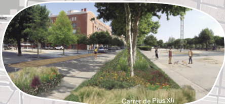
Carrer de Pius XII