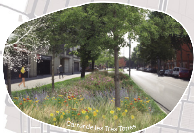
Carrer de les Tres Torres