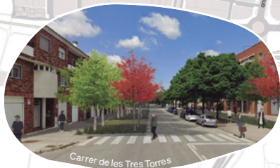
Carrer de les Tres Torres