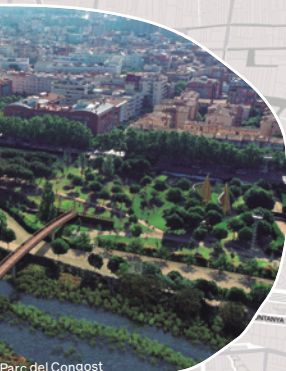
Parc del Congost