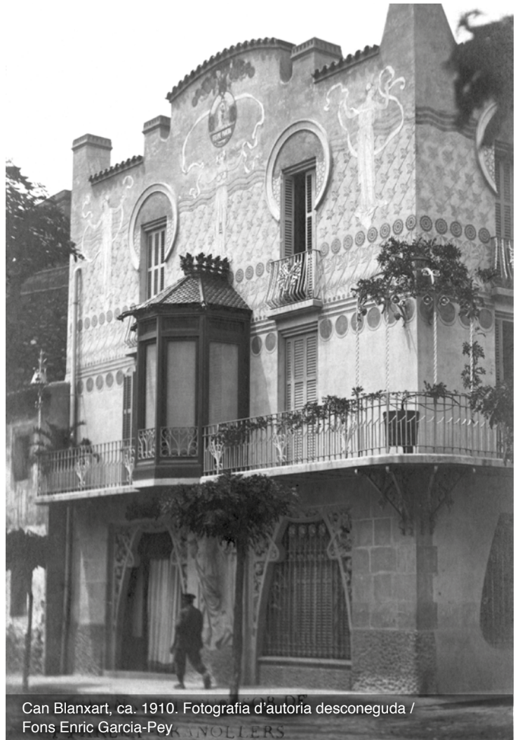
Can Blanart, ca. 1910.