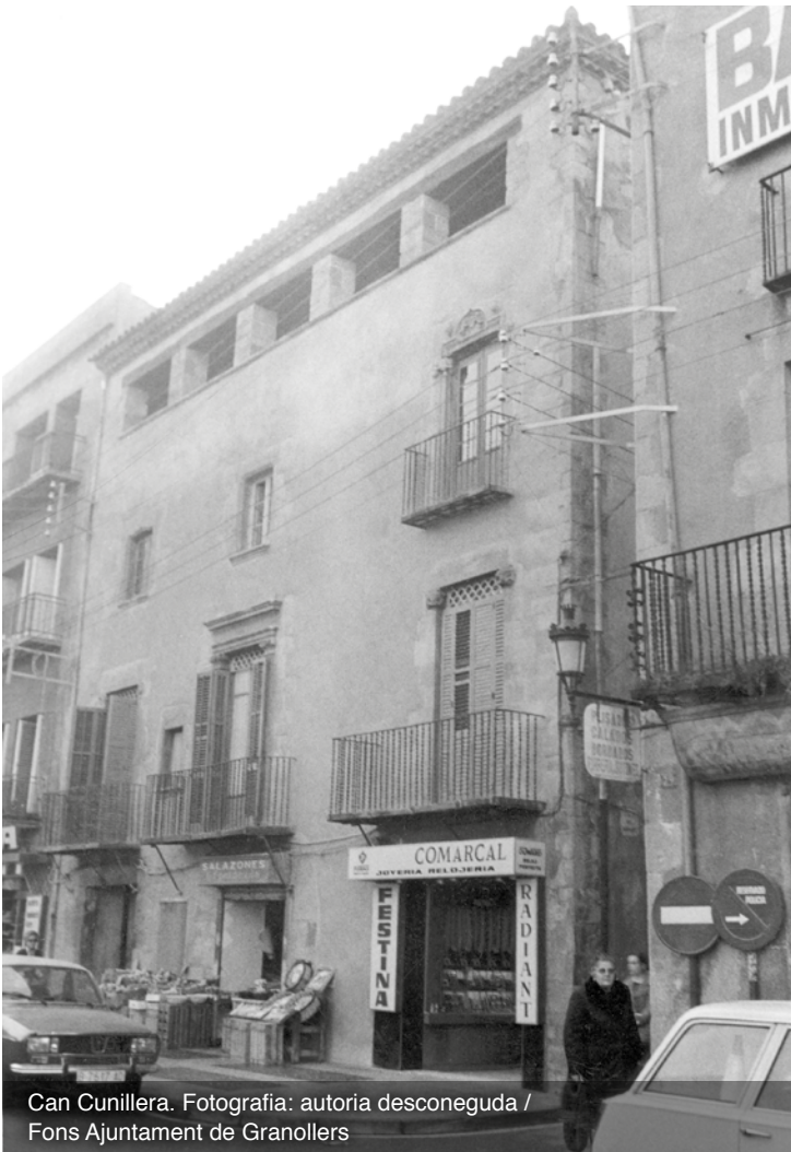
Can Cunillera.