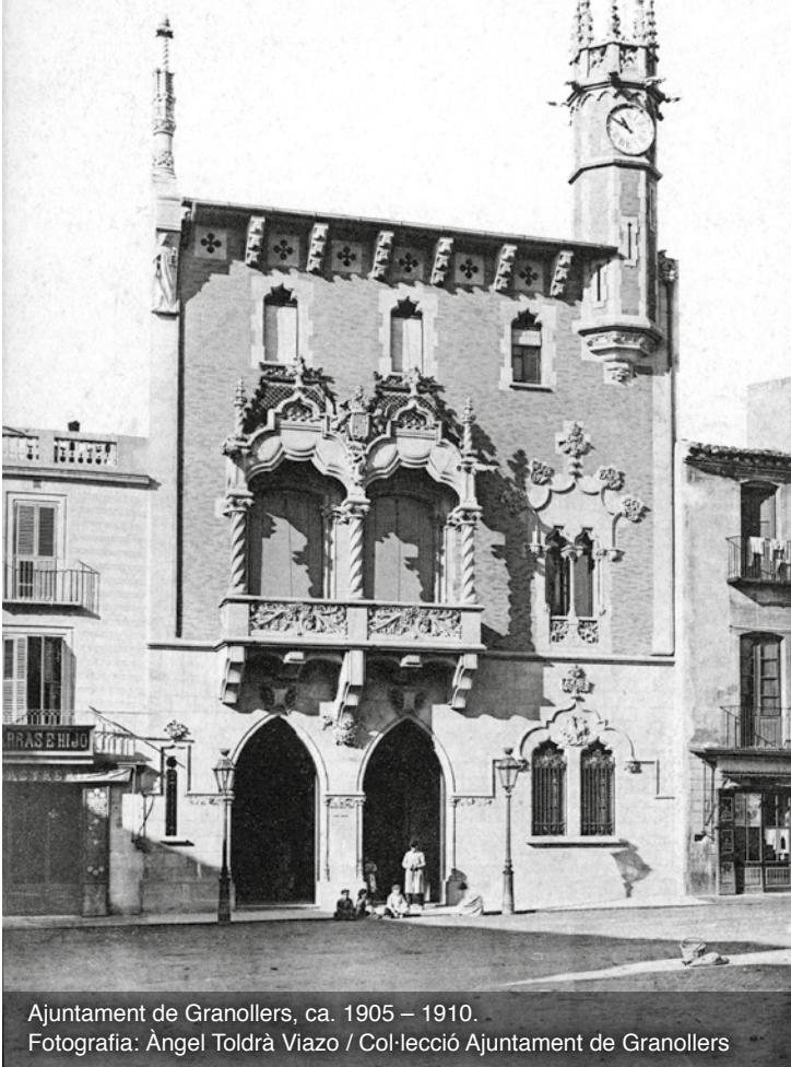
Ajuntament de Granollers, ca. 1905 – 1910.

A. T. V. — 608 - GRANOLLERS Casas Consistoriales