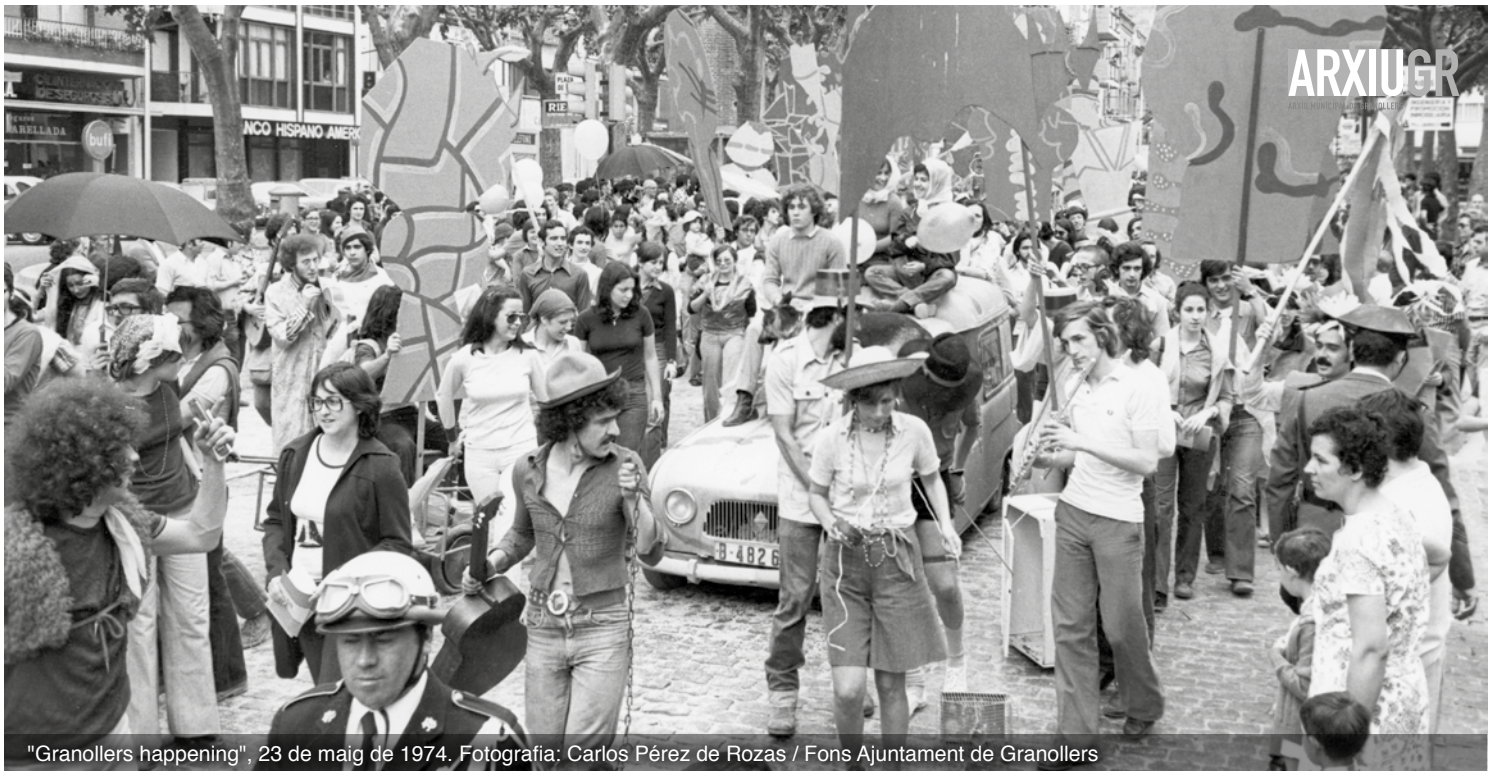
"Granollers happening", 23 de maig de 1974.