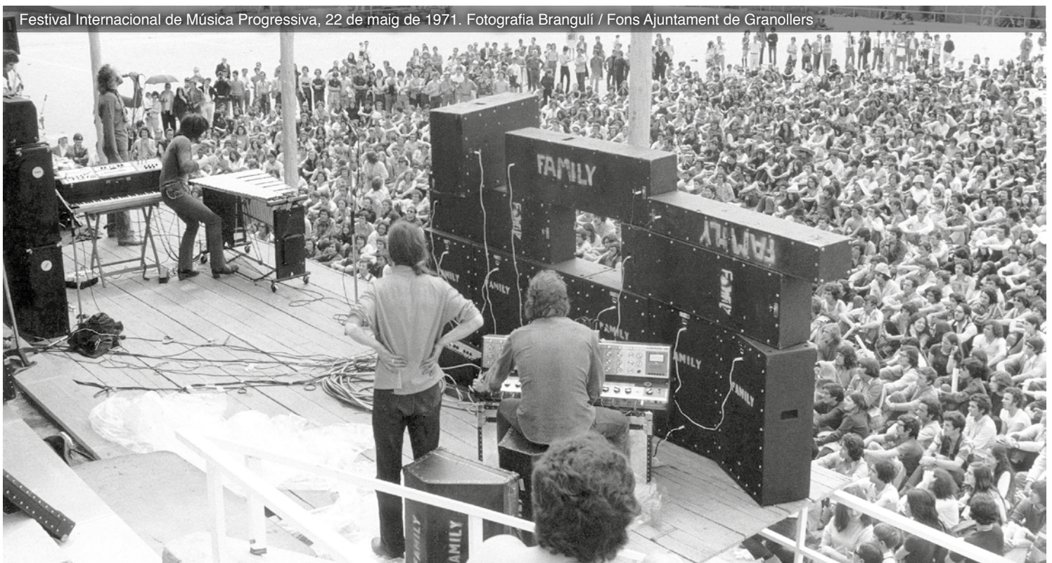
Festival Internacional de Música Progressiva, 22 de maig de 1971.