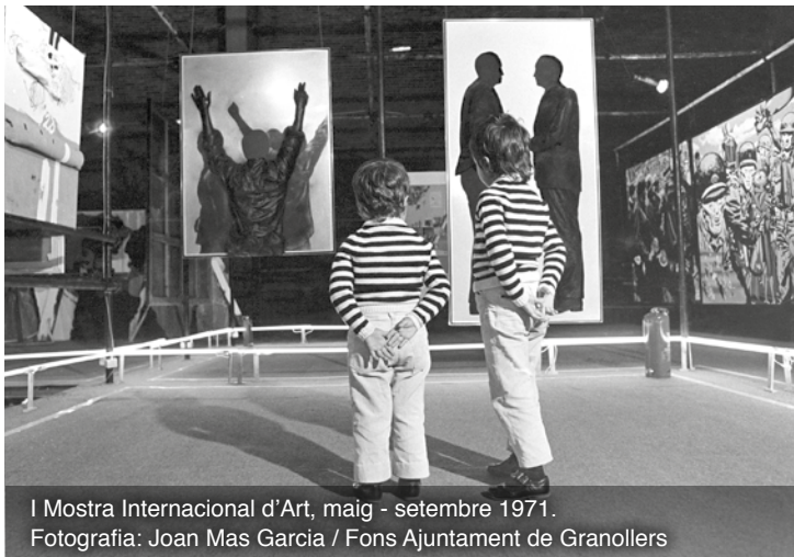
I Mostra Internacional d'Art, maig - setembre 1971.