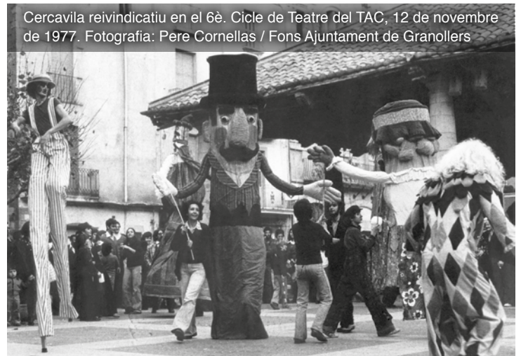
Cercavila reivindicatiu en el 6è. Cicle de Teatre del TAC, 12 de novembre de 1977.