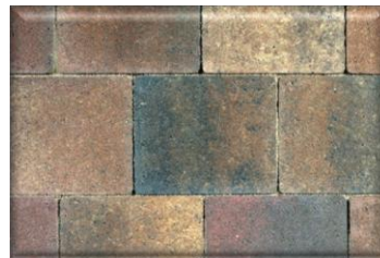
Zona de passar "Mediterráneo"