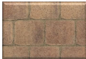
Zona d'estar "Cor-ten"