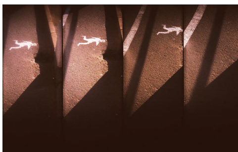
Lluís Estopiñan Fugida, 2011 Lomografia 50 x 70 cm

Després de diverses sessions de pluja d'idees, va acabar imposant-se d'una manera natural el tema del temps. Cites i lectures ens ocupaven al començament, i ens portaven a debatre conceptes. Després ho vàrem enfocar cadascú segons les nostres necessitats expressives.