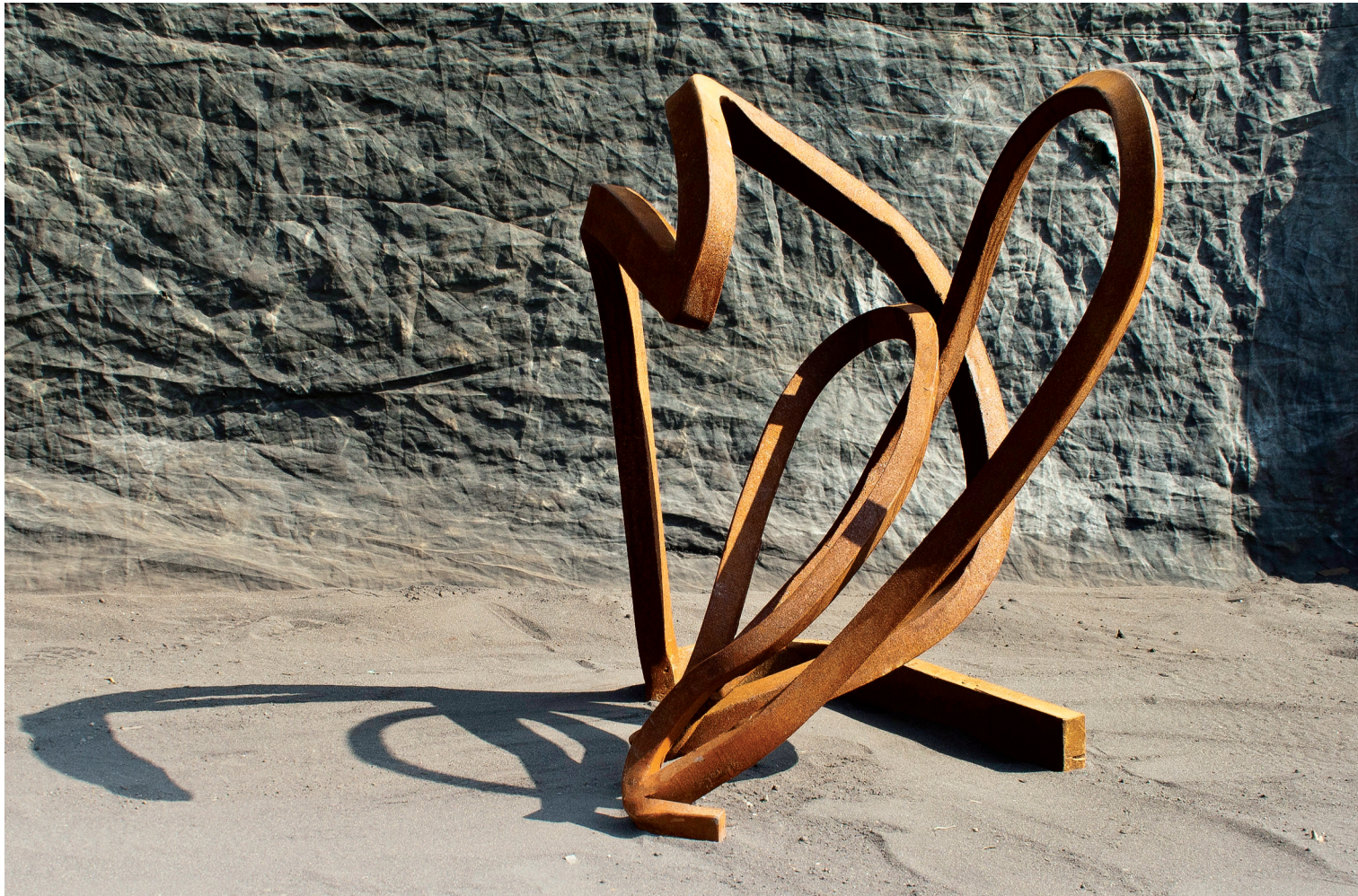
Manel Batlle Decidint estimar , 2011 Ferro soldat i forjat 85 x 70 x 70 cm

Temporal. La vida és un interval de temps. El temps corre per les venes. El temps és un àmbit de possibilitats que se'n generen constantment. Permet que hi hagi esdeveniments, que canviïn les coses. Les coses succeeixen encara que no fem res, però la vida ens permet actuar i fer que en passin algunes de manera més o menys intencionada.