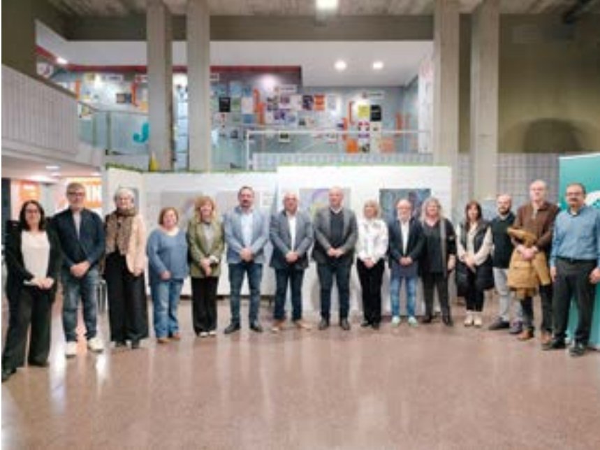
El dia de la presentació de la Fira Guia't a l'equipament juvenil El Gra amb representants de les diferents institucions organitzadores

L'objectiu de la Fira Guia't és crear un espai que acompanyi les persones a respondre la pregunta "A què m'agradaria dedicar-me?" o "Com puc millorar la meva ocupabilitat?" La fira ofereix informació clara i actualitzada sobre l'oferta formativa disponible, quina formació és necessària per arribar-hi o quines són les ocupacions vinculades a cada sector productiu.