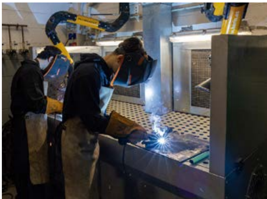
Alumnat de cicles mitjans d'Instal·lacions elèctriques i automàtiques i Manteniment electromecànic de l'EMT