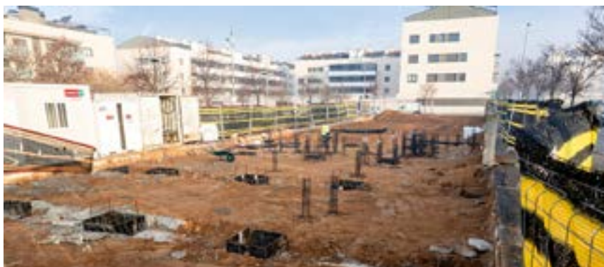
Obres del Cairó, el primer projecte d'habitatge cooperatiu a la ciutat (c. Rosselló)

Barnusell: “per a la ciutat, l'accés a l'habitatge és una prioritat”