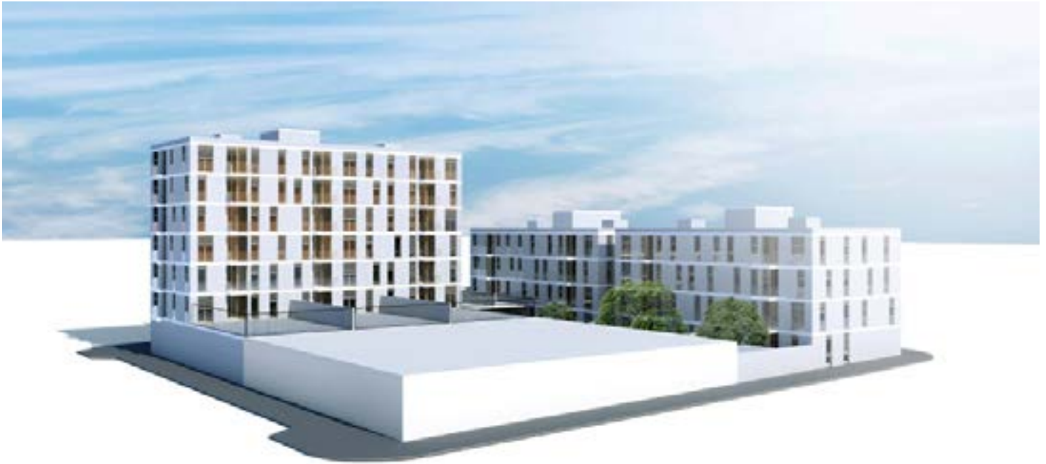
Obres del Cairó, el primer projecte d'habitatge cooperatiu a la ciutat (c. Rosselló)

de lloguer assequible al carrer Ripollès. Aquest projecte és fruit de l'aliança entre l'Ajuntament i l'Incasòl.