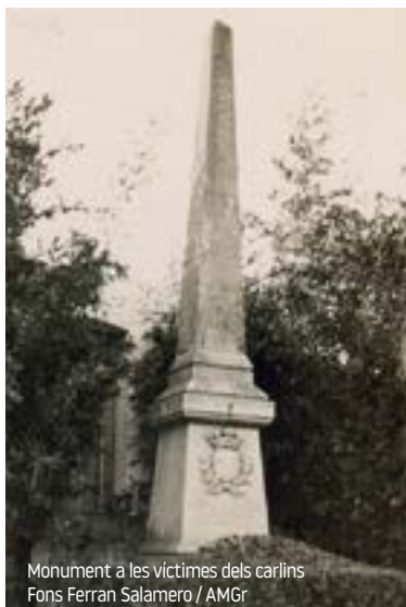
Monument a les víctimes dels carlins

COMMEMORACIÓ DELS 150 ANYS DE L'ENTRADA DELS CARLINS A GRANOLLERS