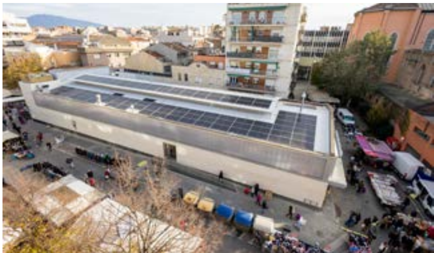
Imatge de les plaques fotovoltaïques que fan aquest equipament més sostenible

La reforma del Mercat Municipal de Sant Carles de Granollers suposa la transformació ambiental, energètica i digital de l'equipament. A l'estiu van iniciar-se els treballs de retirada de la coberta de fibrociment existent i la construcció d'una nova coberta, que ha permès la instal·lació de plaques fotovoltaïques que generaran energia elèctrica per a l'autoconsum del mercat. Es preveu que les plaques solars generaran energia equivalent al 60 % del consum elèctric comunitari del mercat. També s'han incorporat bateries d'acumulació elèctrica que permetran emmagatzemar l'energia elèctrica generada no consumida durant el dia per abastir les cambres frigorífiques i altres equips que funcionen 24 hores els 7 dies de la setmana.