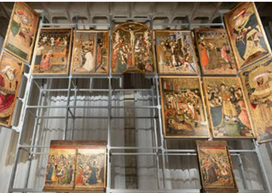
A la dreta, les 13 taules del retaule de sant Esteve remuntades a l'interior del Museu. A la dreta, la visita a l'exposició Històries sense paraules, el dia de la reobertura del Museu