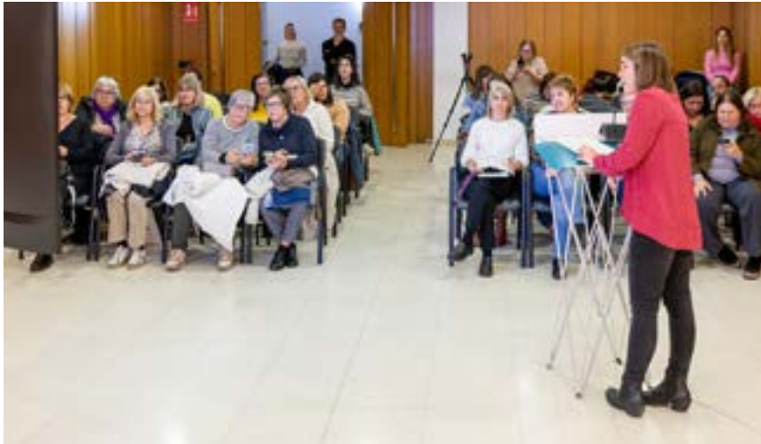
La presentació pública del IV Pla d'Igualtat de Gènere 2025-2030 a la Sala de Plens

L'Ajuntament ha aprovat el IV Pla d'Igualtat de Gènere 2025-2030, un document estratègic que reforça el compromís de la ciutat amb la igualtat entre dones i homes. Aquest Pla és el resultat d'un procés participatiu ampli i transversal, que ha involucrat més de 150 persones i representants de diverses entitats i institucions.