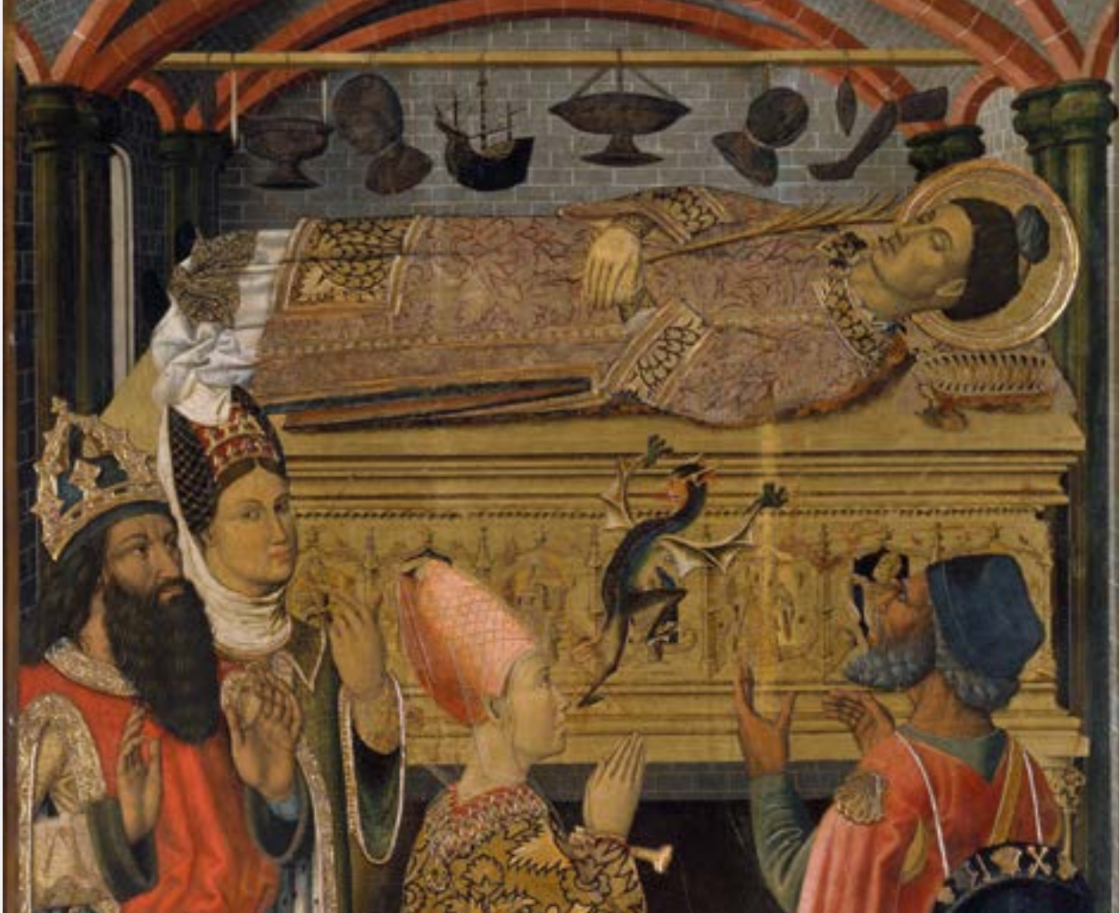
Grup Vergós. La princesa Eudòxia davant la tomba de sant Esteve, 1495–1500. MNAC 24146, (fragment).