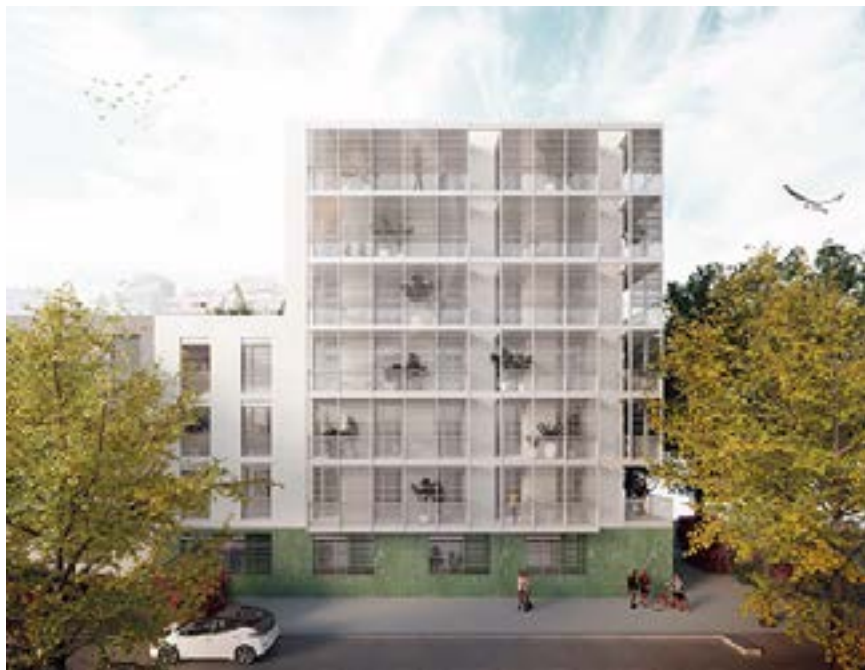
Imatge virtual dels habitatges del passeig de la Muntanya, 187

Granollers disposa de tres solars de titularitat municipal al barri del Lledoner, que sumen 7.790 metres quadrats de sòl edificable. L'Ajuntament té com a prioritat aquest mandat augmentar l'oferta de pisos a preus assequibles a la ciutat. Per això, aquests solars estaven reservats per a habitatge. Calia, però, que la Generalitat fes un pas endavant per iniciar la construcció, que el consistori no pot assumir amb recursos propis.