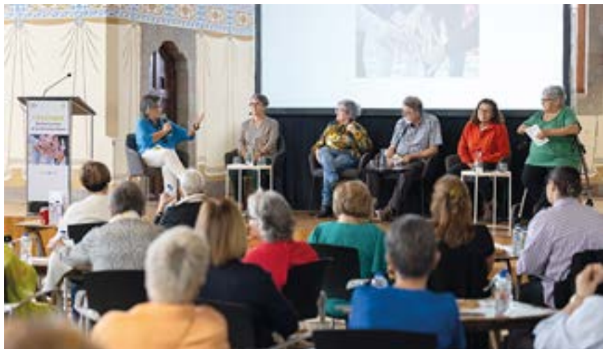
Commemoració del Dia Internacional de les Persones Grans

Aquesta tardor s'ha constituït el Fòrum de les Persones Grans de Granollers, un espai de participació ciutadana obert a totes les entitats i organitzacions que actuen en l'àmbit de les persones grans de la ciutat, i a tothom qui, de manera individual o col·lectiva, vulgui implicar-se en el benestar d'aquest sector de la població.