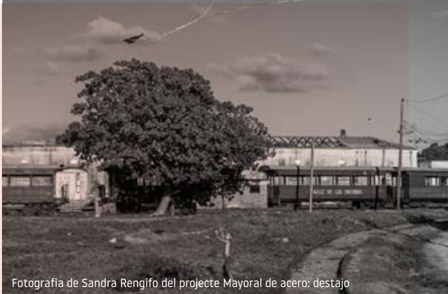
Fotografia de Sandra Rengifo del projecte Mayoral de acero: destajo