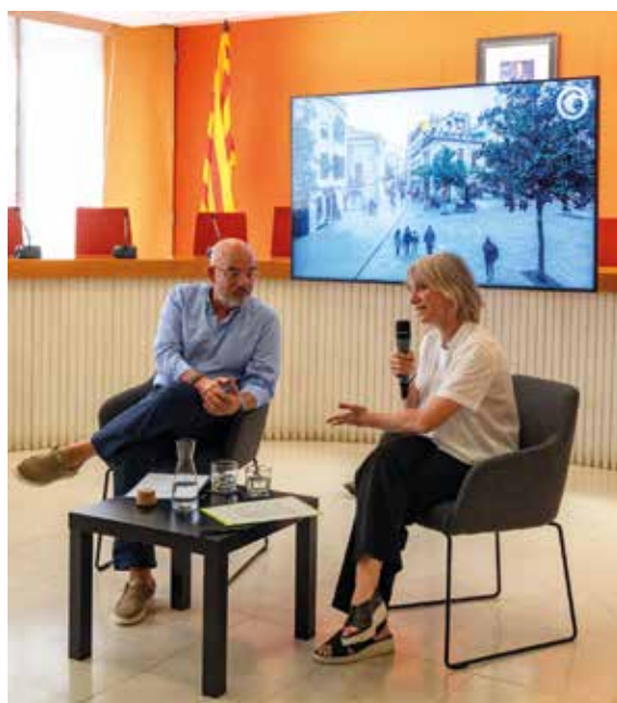
A dalt, fotografia del nou grup de treball assessor, amb membres de la corporació

En aquesta línia, es destinaran 80.000 euros a ajuts a la creació de noves empreses, amb quanties més elevades en cas que la seva activitat sigui comerç al detall, una cooperativa o una proposta vinculada a la indústria cultural i creativa; també si es tracta de locals buits comercials situats en planta baixa o dins la zona de baixes emissions (ZBE).