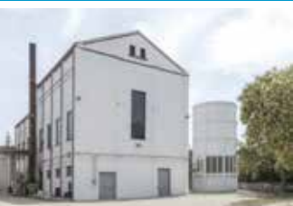
Roca Umbert Fàbrica de les Arts

En els seus trenta anys d'existència, Manifesta s'ha convertit en una de les biennals d'art contemporani més influents del món. Basada en la cocreació, Manifesta vincula la recerca urbana del territori i les seves comunitats amb l'art contemporani internacional i implica ciutadans locals, organitzacions de base i socis institucionals per abordar les qüestions culturals i socials plantejades per la ciutat d'acollida.