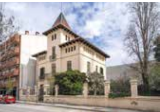
Museu de Ciències Naturals