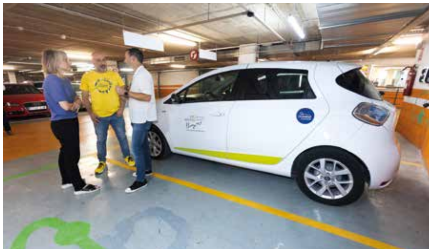
Els cotxes estan ubicats a l'aparcament de Can Comas

Granollers posa a disposició de la ciutadania dos vehicles elèctrics d'ús compartit fruit de la col·laboració entre la cooperativa Som Mobilitat i l'Ajuntament. Es tracta de dos vehicles elèctrics amb una autonomia de 350 km. El nou servei de lloguer de vehicles elèctrics compartits representa una aposta per promoure la mobilitat sostenible. Es tracta d'una iniciativa de l'Ajuntament, emmarcada dins de les accions per impulsar la transició energètica i la lluita contra el canvi climàtic.