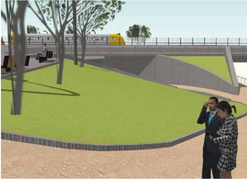
Imatge virtual del nou pas soterrat

Aquest estiu han començat les obres per construir un nou pas soterrat a l'estació de Granollers-Canovelles, que comunicarà l'avinguda de l'Estació del Nord amb el costat