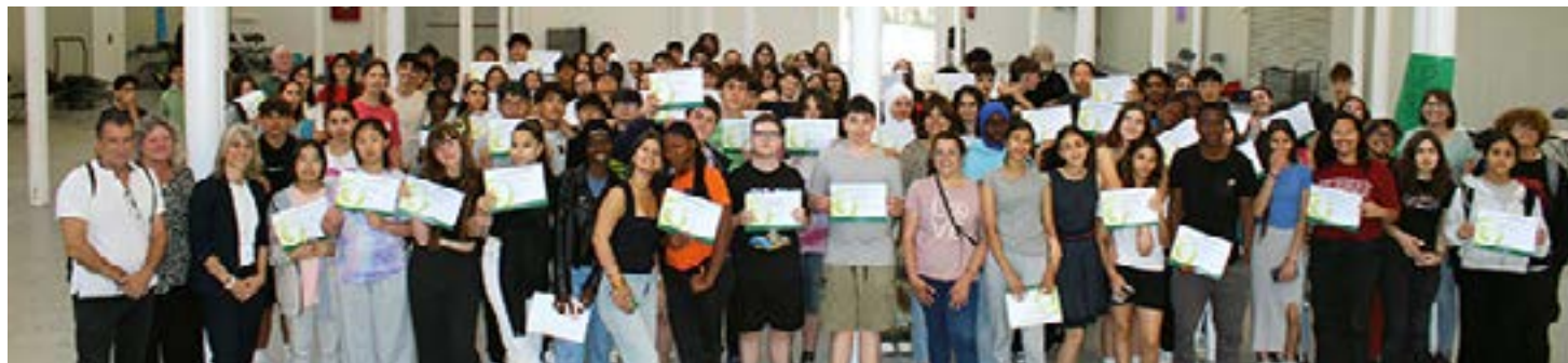
Foto de grup dels alumnes que van assistir a la 6a Trobada de Mediació Escolar celebrada el 31 de maig a la Nau Dents de Serra de Roca Umbert

Un total de 115 alumnes han participat en la 6a Trobada de Mediació Escolar, que s'ha celebrat el 31 de maig, a la Nau Dents de Serra de Roca Umbert. Aquest curs, han format part del projecte de mediació entre iguals cinc centres educatius de la ciutat: els instituts Celestí Bellera, Antoni Cumella, Marta Estrada, Educem i l'Escola Municipal de Treball.