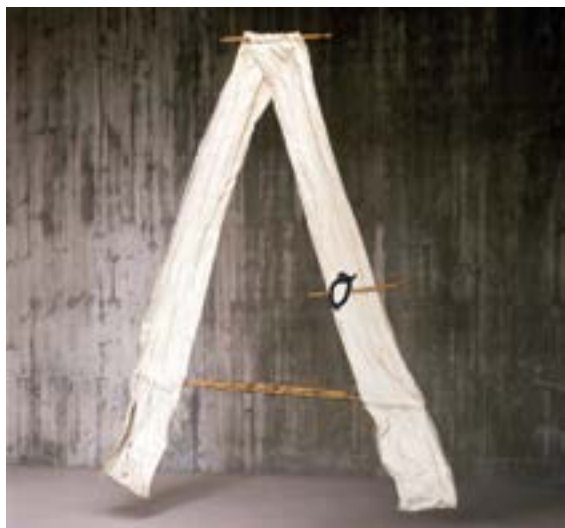
Antoni Tàpies A, 1977. Obra en paper i fusta.