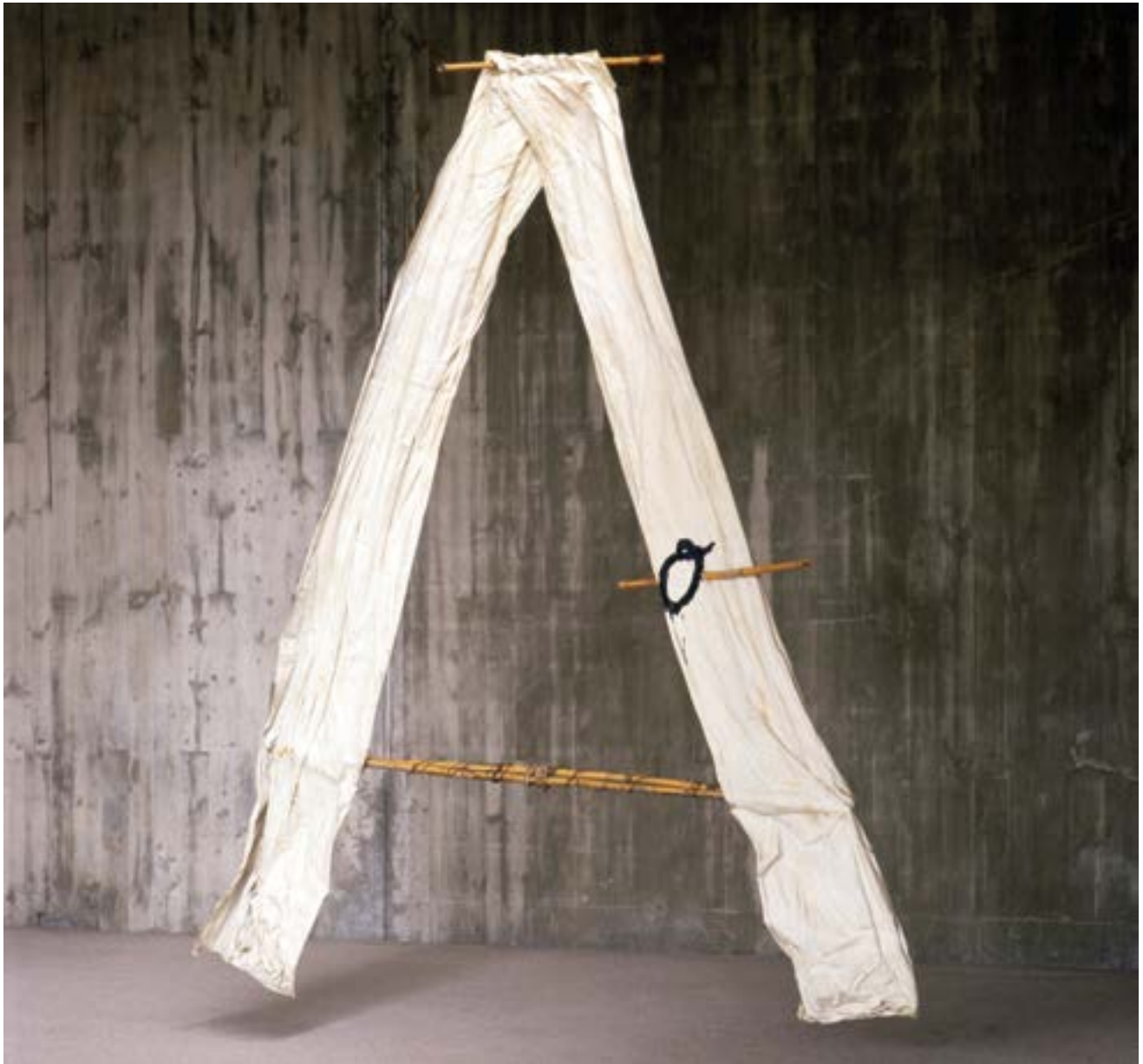
Antoni Tàpies A, 1977, tècnica mixta MAG 650