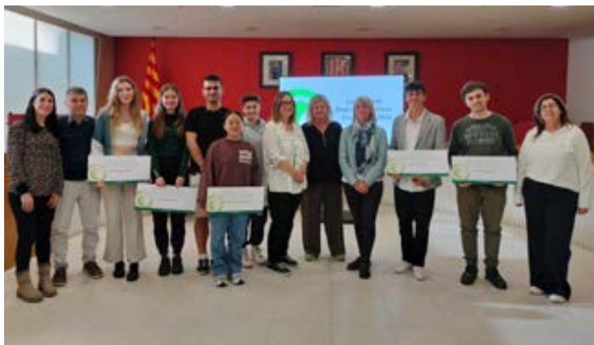
Lliurament de les beques Erasmus+ als nou alumnes de formació professional de grau superior

Nou alumnes de formació professional de grau superior de la ciutat han obtingut les beques Erasmus+ que atorga l'Ajuntament de Granollers. Entre els seleccionats hi ha un alumne de l'Educem, cinc de l'EMT i tres de l'institut Carles Vallbona. Aquesta beca els ha permès fer pràctiques professionals en diversos països europeus com Itàlia, Irlanda, Alemanya, República Txeca i Holanda.