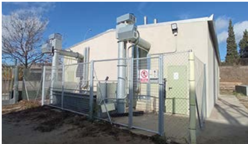
Central de producció d'energia de la xarxa sud de calor, prop de les pistes d'atletisme

pel passat i el present de la fàbrica a través d'un mapatge audiovisual que permet interpretar el patrimoni industrial de la fàbrica i reflexionar sobre els usos de l'energia i el seu futur. Les visites són els dissabtes, a les 17.30 i a les 19 h, i els diumenges, a les 11 h i a les 12.30 h.