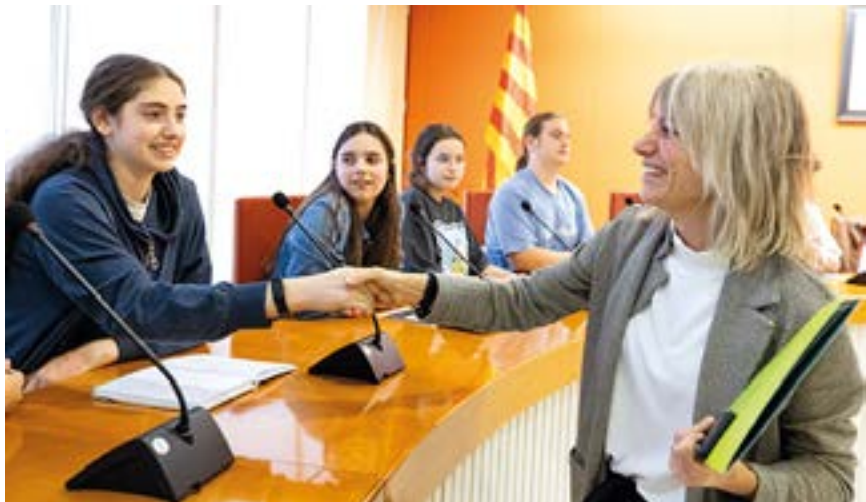
L'audiència pública de l'Arrel-Fòrum de les Adolescències amb l'alcaldessa a la Sala de Plens

El consell local de participació de l'Arrel-Fòrum de les Adolescències està format per una trentena de joves de 12 a 16 anys en representació dels centres educatius de secundària i educació especial de la ciutat, les entitats de lleure i els centres oberts. Tots ells es troben a final de curs per fer balanç. Una audiència pública en la qual presenten a l'alcaldessa les conclusions del que han treballat. Aquest curs s'han implicat en el projecte de renaturalització del riu Congost, juntament amb el Consell dels Infants. Han participat en el projecte de creació d'una ciutat més verda, han treballat activament en la definició i creació de nova senyalització