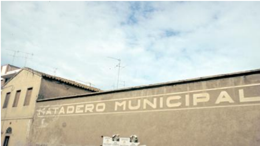
Exterior de l'Escorxador Municipal, anys 80.