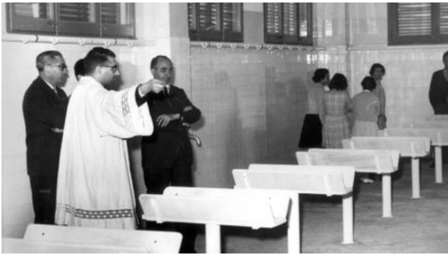
Interior de l'Escorxador Municipal de l'any 1900