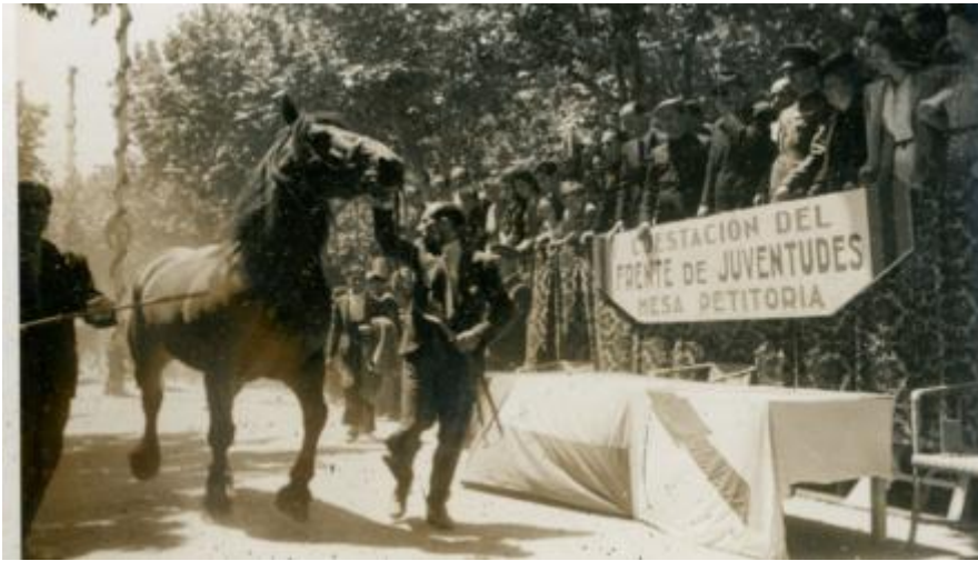
Bestiar del Vallès, 1943.