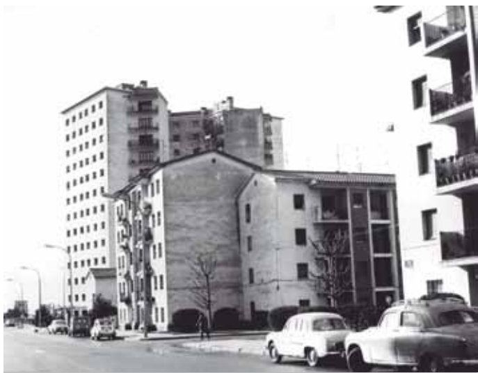
1970.