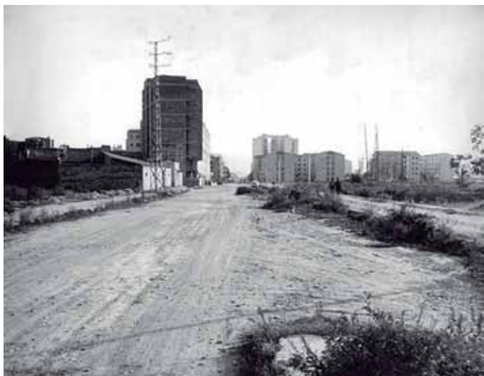
1961.