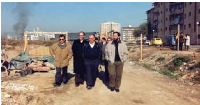
1987.