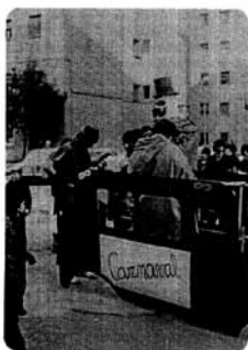
Any II - Febrer - 1981 - Nº 3

del Camí Ral - GRANOLLERS BUTLLETÍ DE L'ASSOCIACIÓ DE VEÏNS, I DE L'ASSOCIACIÓ DE PARES C.N. VICTORIA