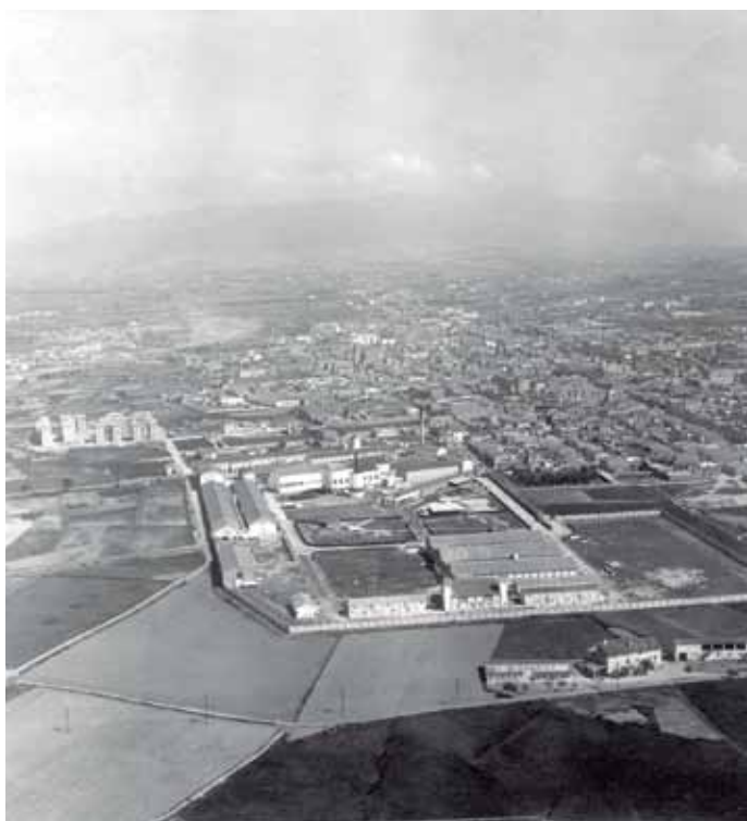
1951. Trabajos aéreos fotogramétricos / Ajuntament de Granollers / AMGr-Arxiu d'Imatges

“Un bloc de pisos i tot envoltat d’horts. Hi havia un rec petit darrere dels bloc de pisos i un caminet que donava a la fàbrica de Can Comas”. P. Samon