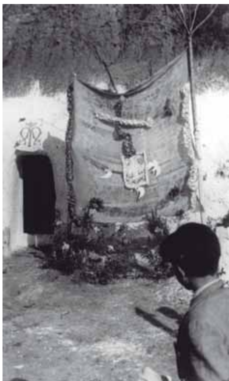
1952.